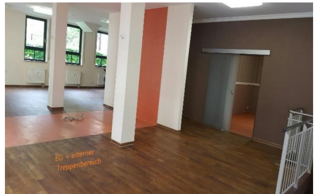
LADENFLÄCHE ebenerdiges ENTREE | Glastüreingang EG | aufteilbar in Laden 1 + 2 oder großzügig einteilige Flächennutzung ca. 190 m 2