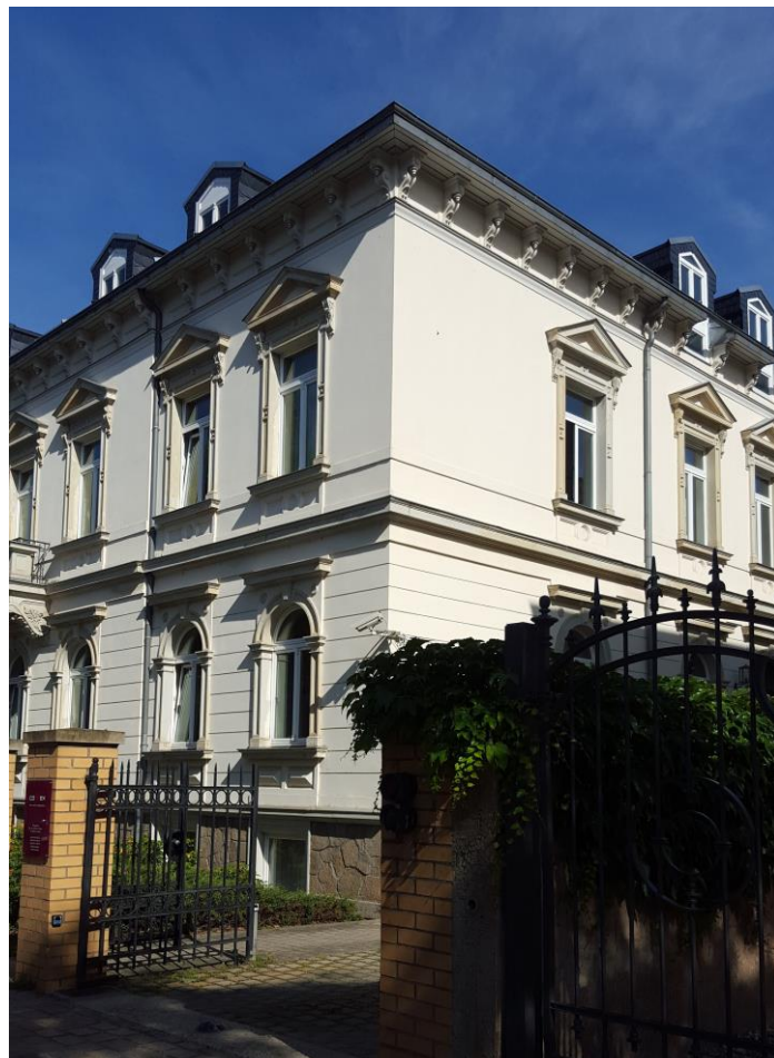
Dachgeschoss / 2. OG