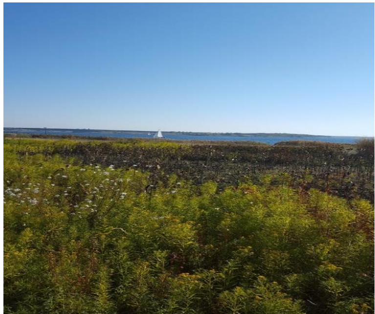
Beispielhaft für die Weite